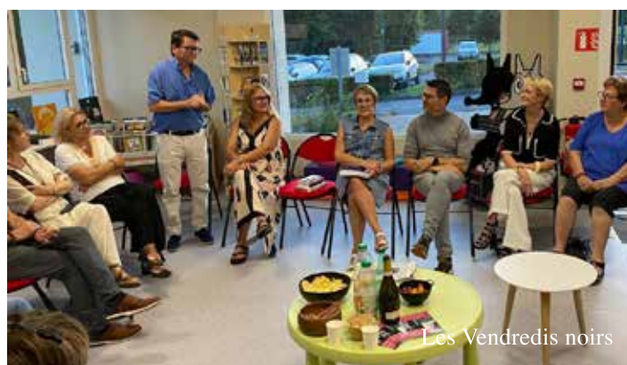
Les Vendredis noirs